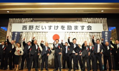
⑭⑮⑯⑰「西野だいすけを励ます会」(令和元年10月12日)の様子 自民党元幹事長の古賀誠先生を来賓にお迎えし、1,000名を超える方にお越しいただきました。