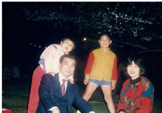
↑城東小学校時代@熊本城飯田丸広場にて家族と花見