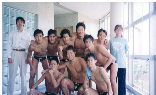
→東京大学時代@水球の試合会場にて仲間たちと（前列中央）