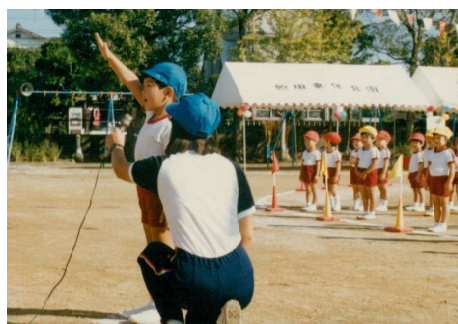
↑飽田東保育園時代@運動会にて選手宣誓