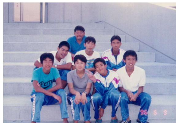
↑熊本高校時代@水球の練習の後、仲間たちと（2列目左）