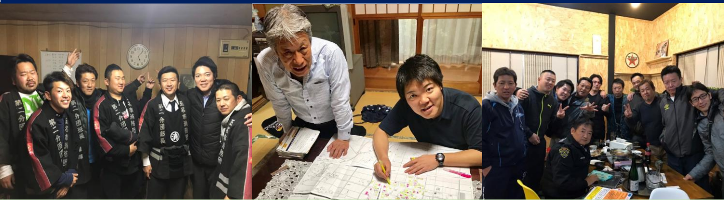
①玉名市で消防団夜警に参加 ②飽田地区の戸別訪問後の様子 ③田迎南校区での懇親会