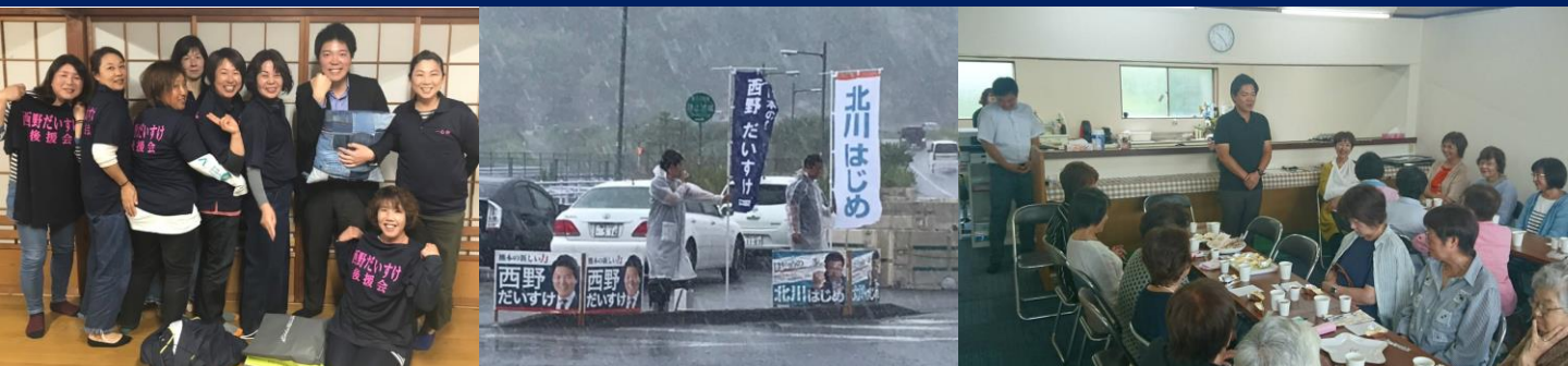
⑦後援会女性部「一心会支部」立上げ ⑧辻立ちの様子 ⑨荒尾市での懇談会