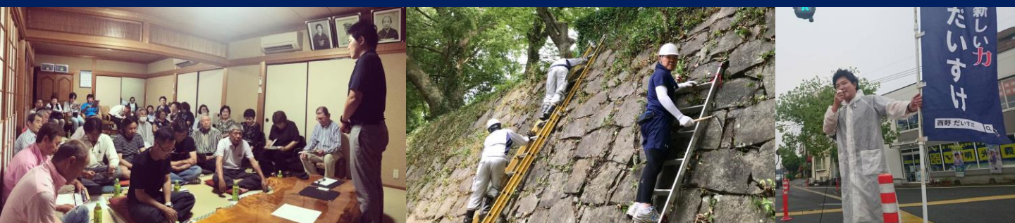
⑬ミニ集会の様子 ⑭熊本城の石垣清掃に参加 ⑮辻立ちの様子