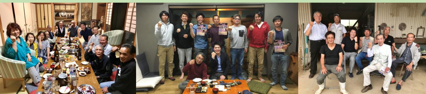
⑩松尾地区での懇親会 ⑪力合西校区での懇親会 ⑫長洲町での懇談会