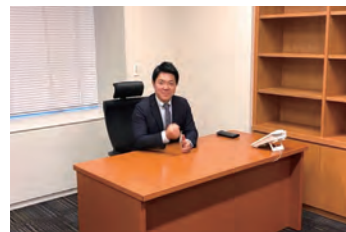
議員会館執務室の様子

令和3年11月10日、特別国会が召集され、初登院いたしました。その後、早速、地元の皆さまや各種団体の皆さまから要望を伺い、関係省庁と打ち合わせを行うなど、仕事にとりかかっています。