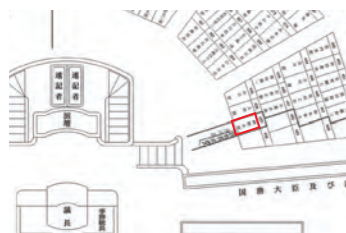
衆議院本会議場の座席表