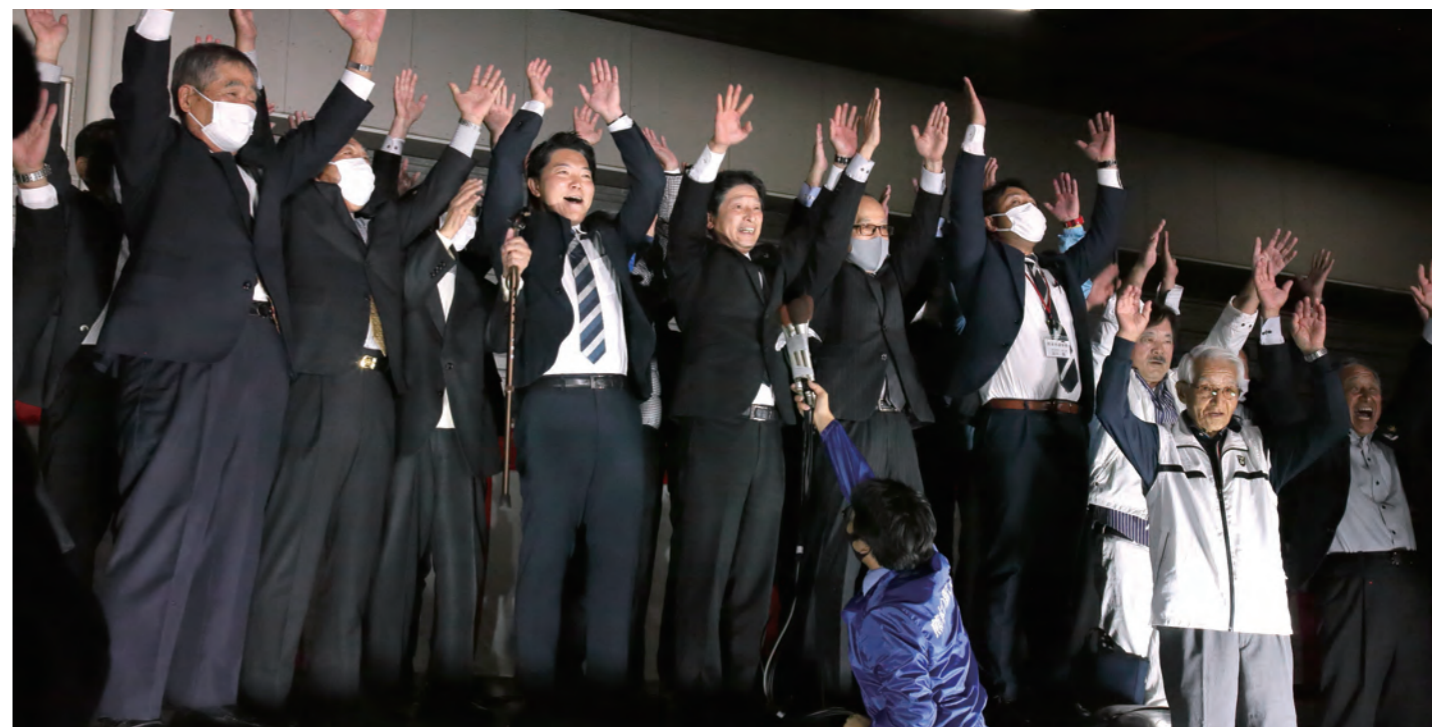
当選確実の報道を受け、後援会の皆さまと万歳する様子

公職選挙法の規定により、選挙に関するお礼の文言を書くことができません。ご理解いただきますようお願いいたします。