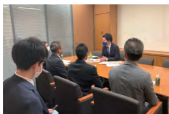
関係省庁から説明を受ける様子