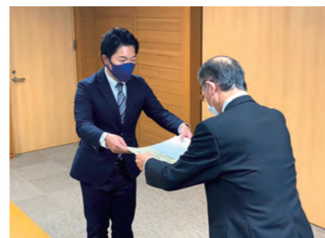
当選証書授与式の様子