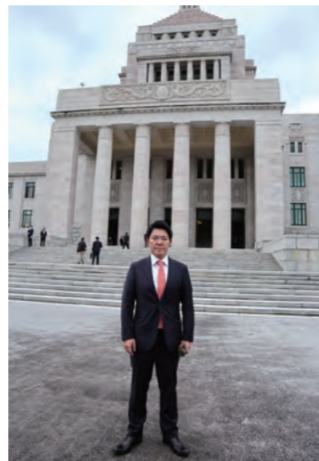
国会議事堂前にて