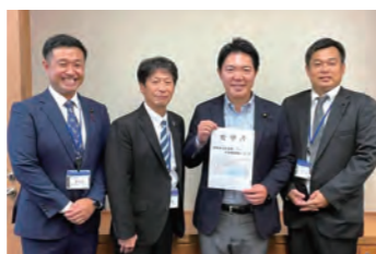
同志議員と議員会館にて