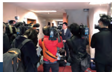
入党願提出記者会見の様子