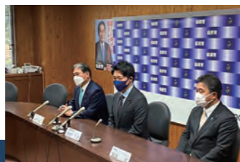
自民党入党記者会見の様子

令和3年12月、自由民主党に入党いたしました。併せて、自由民主党熊本県第二選挙区支部長に就任いたしました。