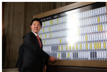
登院表示盤を押す様子