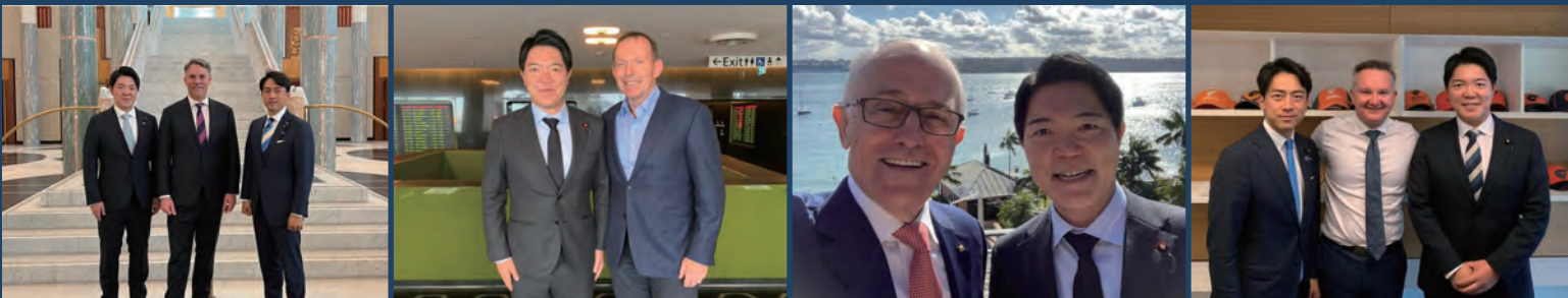
マールズ副首相と

小泉進次郎議員と共に、オーストラリアを訪問しました。現職閣僚や元首相などと率直な意見交換を行ったほか、防衛・環境関連施設の視察などを行いました。日豪関係強化のための課題を深く認識しました。