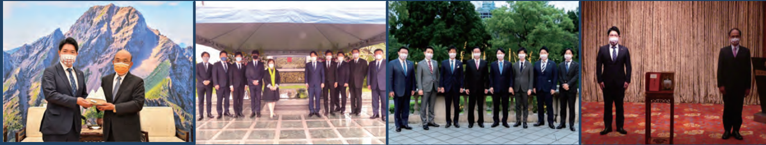
蘇貞昌行政院長（総理大臣）と 李登輝元大統領の墓地にて 吳釗燮外交部長（外務大臣）と 游錫堃立法院長（議長）と

青年局国際部副部長として、台湾を訪問しました。訪台中は、台湾政府や経済界の要人と今後の日台関係強化のため、具体的な意見交換を行いました。